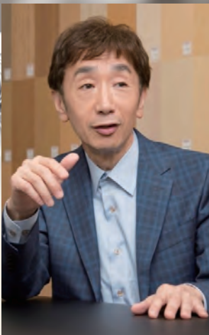
株式会社コロブスのたまご フードビジネスコンサルタント